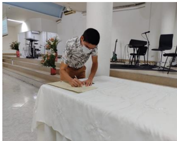
Firma de compromiso