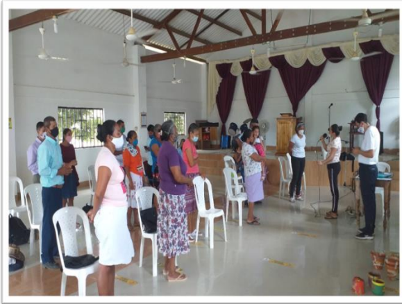
Ilustración 1 Encuentro en la Iglesia Presbiteriana de Currulao

Esta experiencia arrancó desde el segundo semestre del 2019 en la Iglesia Presbiteriana de Apartadó, de ahí se trasladó a las iglesias de Saiza, Pueblo Bello y Currulao. Se tenía previsto el cierre de los encuentros para el mes de mayo del 2020, sin embargo, dado al confinamiento nacional decretado por la emergencia sanitaria provocada por la propagación del Covid 19 se postergó. Ahora bien, para darle desarrollo a la agenda de Dipaz, los encuentros se retomaron y para el 7 de noviembre se llevó a cabo