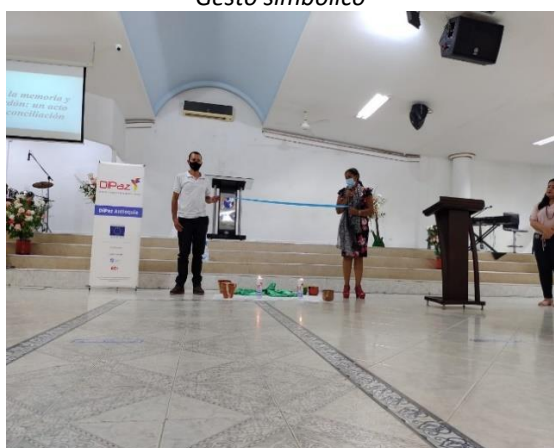
Símbolo de reconciliación