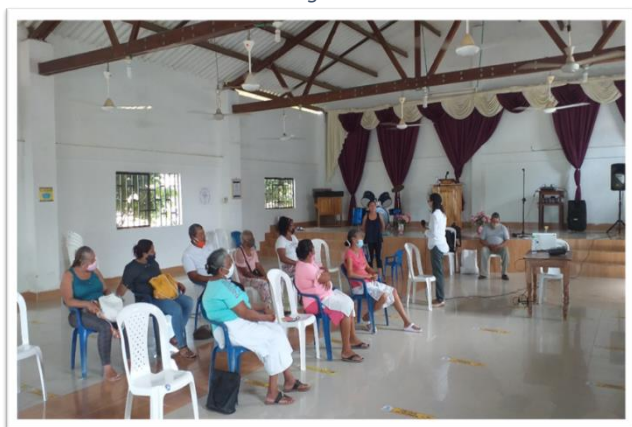
Ilustración 3 Encuentro en la Iglesia Presbiteriana de Currulao

El objetivo del encuentro consistió en enunciar a las mujeres de iglesias víctimas del conflicto armado las fases del duelo, como tramitarlo y como acompañar a otros en un proceso de pérdida. Además, de recoger insumos para la terminación de la cartilla que se presentará como producto de la experiencia en reconciliación.